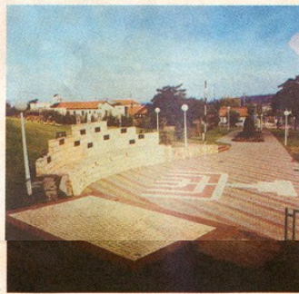
האנדרטה בשלומי. לזכר חללי היישוב