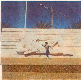
האנדרטה בגנתיה. לזכר חללי חיל החימוש