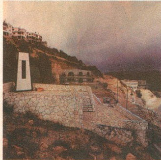
האנדרטה בחורמיש. לזכר חללי הכפר